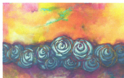
Messengers. Acrilica sobre tela, 2015.