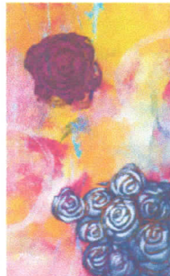
Primavera. Acrilica sobre tela, 2015.