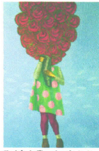
Sin título. Acrilica sobre tela, 40x47 pulgadas, 2014.