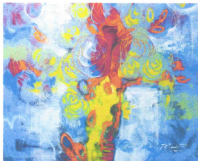
Alquimia. Acrilica sobre tela, 2015.